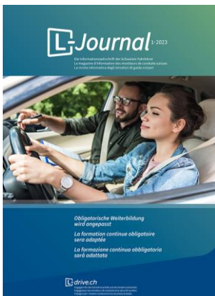
Cover der Ausgabe L-Journal 01/2023

Das L-Journal richtet sich nicht nur an die Mitglieder von L-drive Schweiz / Suisse / Svizzera, sondern auch an Behörden, Ämter und Fachorganisationen, die sich mit den Themen Fahrausbildung und Verkehrssicherheit befassen. Ausserdem gehen regelmässige Grossauflagen an sämtliche Fahrlehrerinnen und Fahrlehrer schweizweit.