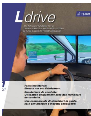
Cover der Ausgabe 01 / 2021

Die L-drive Ausgaben richten sich nicht nur an die SFV-Mitglieder, sondern auch an kantonale und eidgenössische Behörden, Ämter und Fachorganisationen, die sich mit dem Thema Verkehrssicherheit befassen. Ausserdem gehen regelmässig Grossauflagen an sämtliche Fahrlehrerinnen und Fahrlehrer schweizweit.