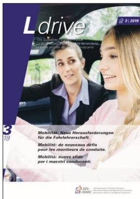
Cover der Ausgabe 3/2019

Die L-drive Ausgaben richten sich nicht nur an die SFV-Mitglieder, sondern auch an kantonale und eidgenössische Behörden, Ämter und Fachorganisationen, die sich mit dem Thema Verkehrssicherheit befassen. Ausserdem gehen regelmässig Grossauflagen an sämtliche Fahrlehrerinnen und Fahrlehrer schweizweit.