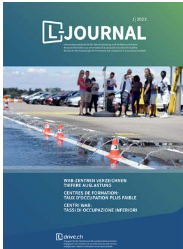
Titelseite der Ausgabe L-JOURNAL 01/2023